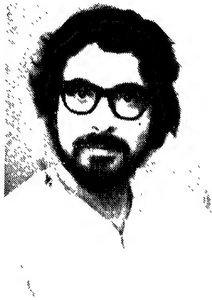
Dr. Amritansusekhar Bagchi Memorial Collection